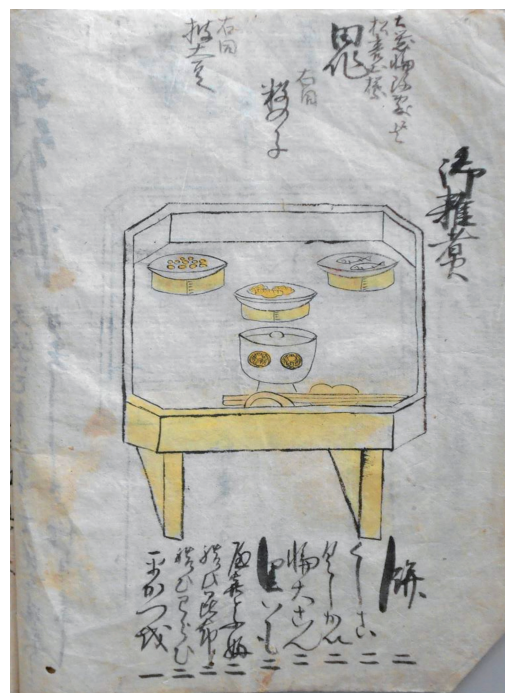
写真1. 「年中行事御祝献立並三方等御飾」 「弘前市立弘前図書館蔵」

これまでの我が国における食事調査に関する先行研究では、食事からの栄養価の算出は第二次世界大